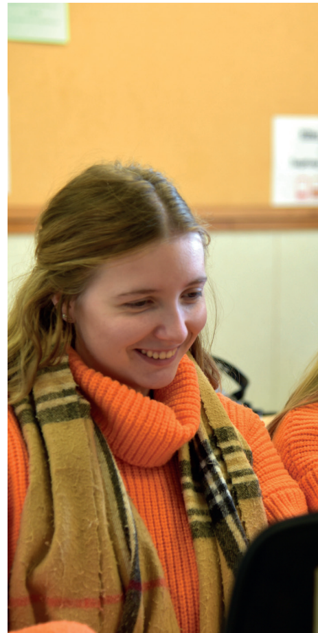
NAAMLOOS LEERJAAR BSO