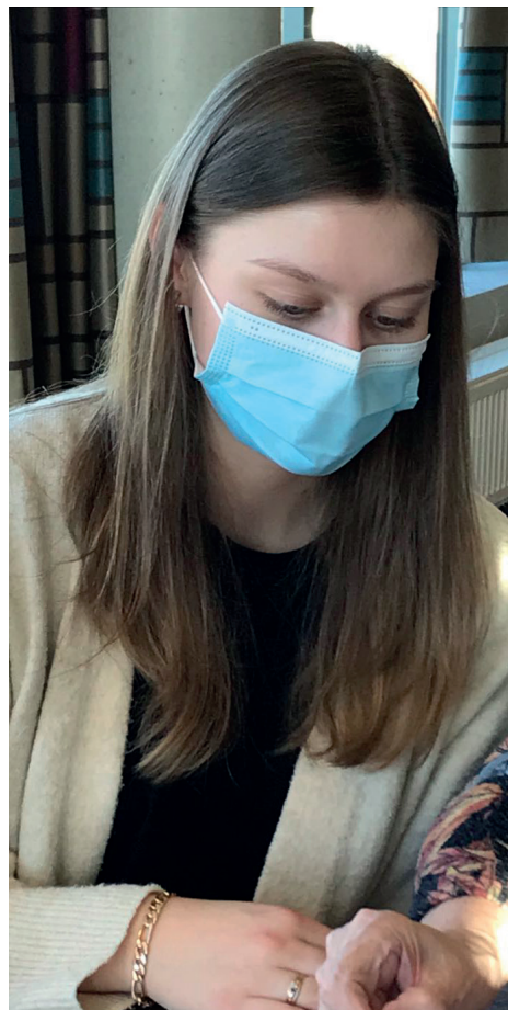
THUIS- EN BEJAARDENZORG /ZORGKUNDIGE ZORGKUNDIGE DUAAL