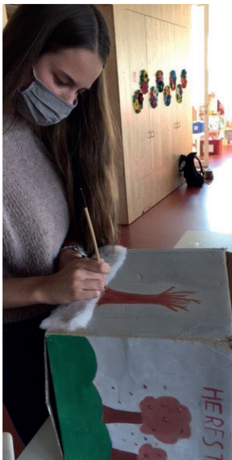
KINDERZORG KINDERBEGELEIDER DUAAL