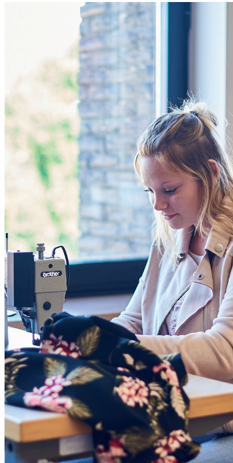
MODESPECIALISATIE EN TRENDSTUDIE